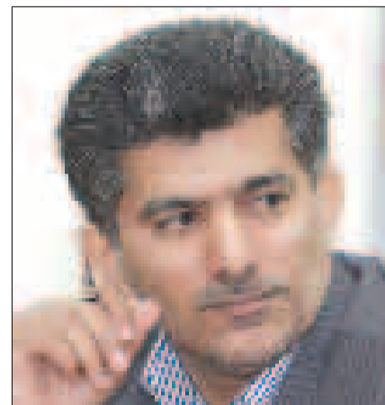
● عبدلی زاده، رئیس سازمان بازرگانی