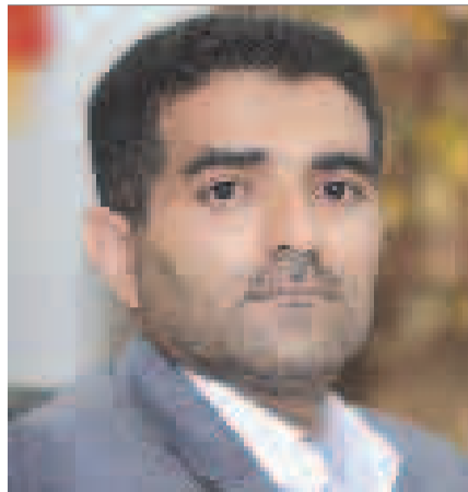
● دشوارگر، معاون تجارت خارجی سازمان بازرگانی