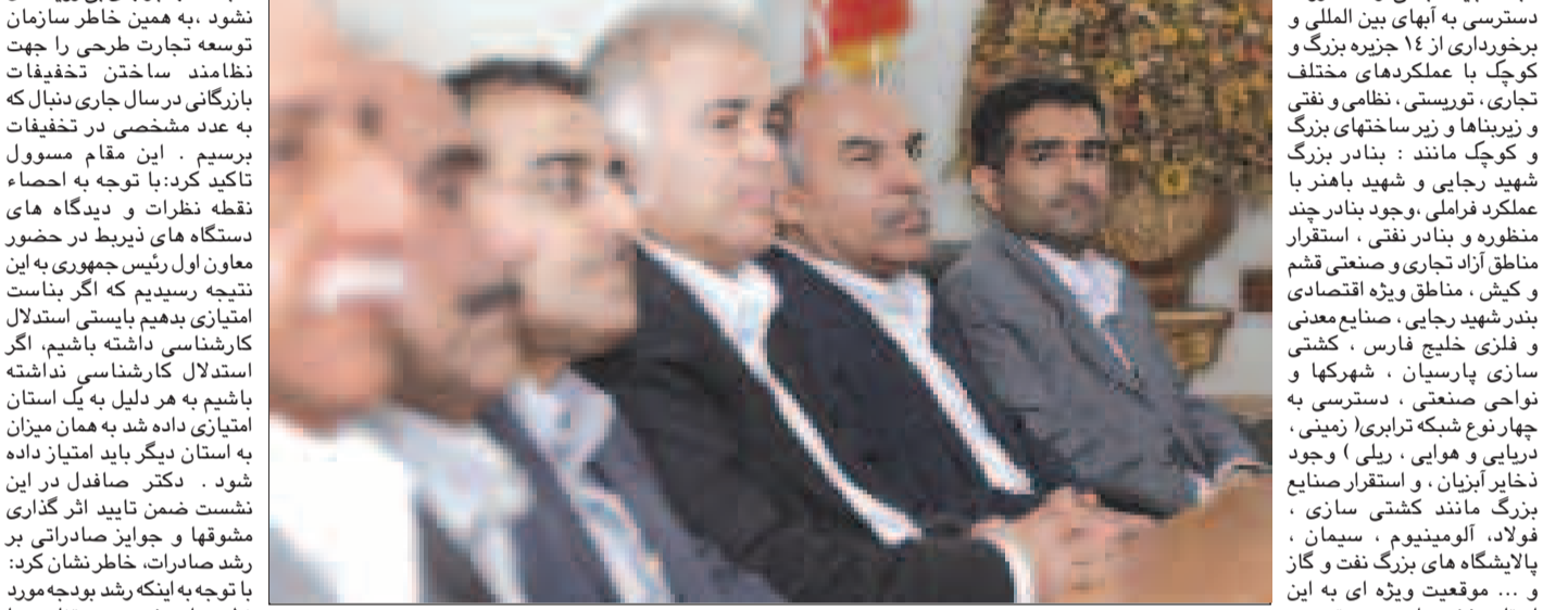
همچنین در جریان سفر دوازده روزه هیات دولت به استان هرمزگان، معاون کل سازمان توسعه تجارت ایران نیز در معیت وزیر بازرگانی وزیر، دکتر صافدل در جمع اعضای