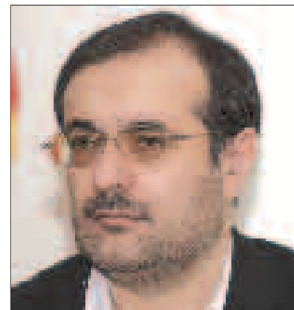
● دکتر غضنفری، وزیر بازرگانی

تعامل سازنده و موثر سازمان بازرگانی استان با اتاق بازرگانی و صنایع و معادن استان و همچنین تشکل های صادراتی، اظهار داشت: با توجه به موقعیت استان هرمزگان و شهرت تجاری آن که به عنوان یکی از بزرگترین مراکز خدمات تجاری محسوب می گردد، سازمان بازرگانی استان هرمزگان به عنوان یک دستگاه حاکمیتی و فرابخشی، وظیفه خود می داند که اهتمام لازم را در چارچوب برنامه راهبردی تجارت خارجی استان داشته باشد تا در فرایند توسعه و تجارت خارجی به بهترین شکل ممکن تسریع شود.