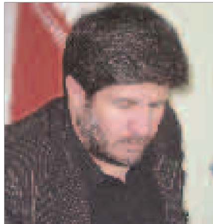
● دکتر صافدل، معاون کل سازمان توسعه تجارت ایران