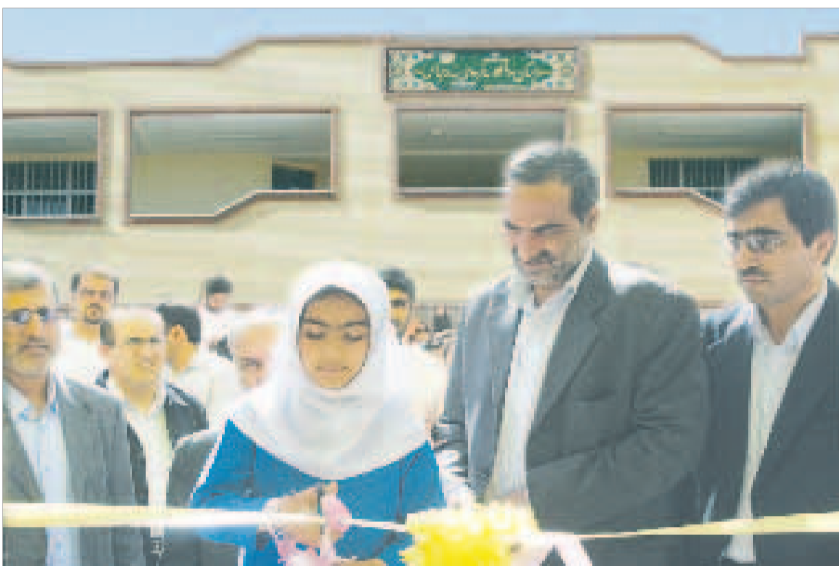
آیین افتتاح دبستان ۱۰ کلاسه "فردوسی" با حضور معاون عمرانی وزیر آموزش و پرورش