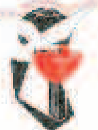
بنیاد شهید و امور ایثارگران سازمان استان هرمزگان

سازمان بنیاد شهید و امور ایثارگران استان هرمزگان در نظر دارد تعدادی از خودروهای خود را به شرح ذیل از طریق مزایده کتبی به فروش برساند لذا از متقاضیان دعوت به عمل می آید حداکثر به مدت ۷ روز کاری از مورخ ۸۸/۱۰/۱۴ تا ۸۸/۱۰/۲۰ در ساعات اداری جهت اخذ تکمیل فرم شرایط شرکت در مزایده و بازدید خودروها به اداره پشتیبانی سازمان بنیاد شهید و امور ایثارگران واقع در بندرعباس کوی دامائی خیابان بنیاد شهید کوچه گوهران ۱۳ مراجعه نمایند.