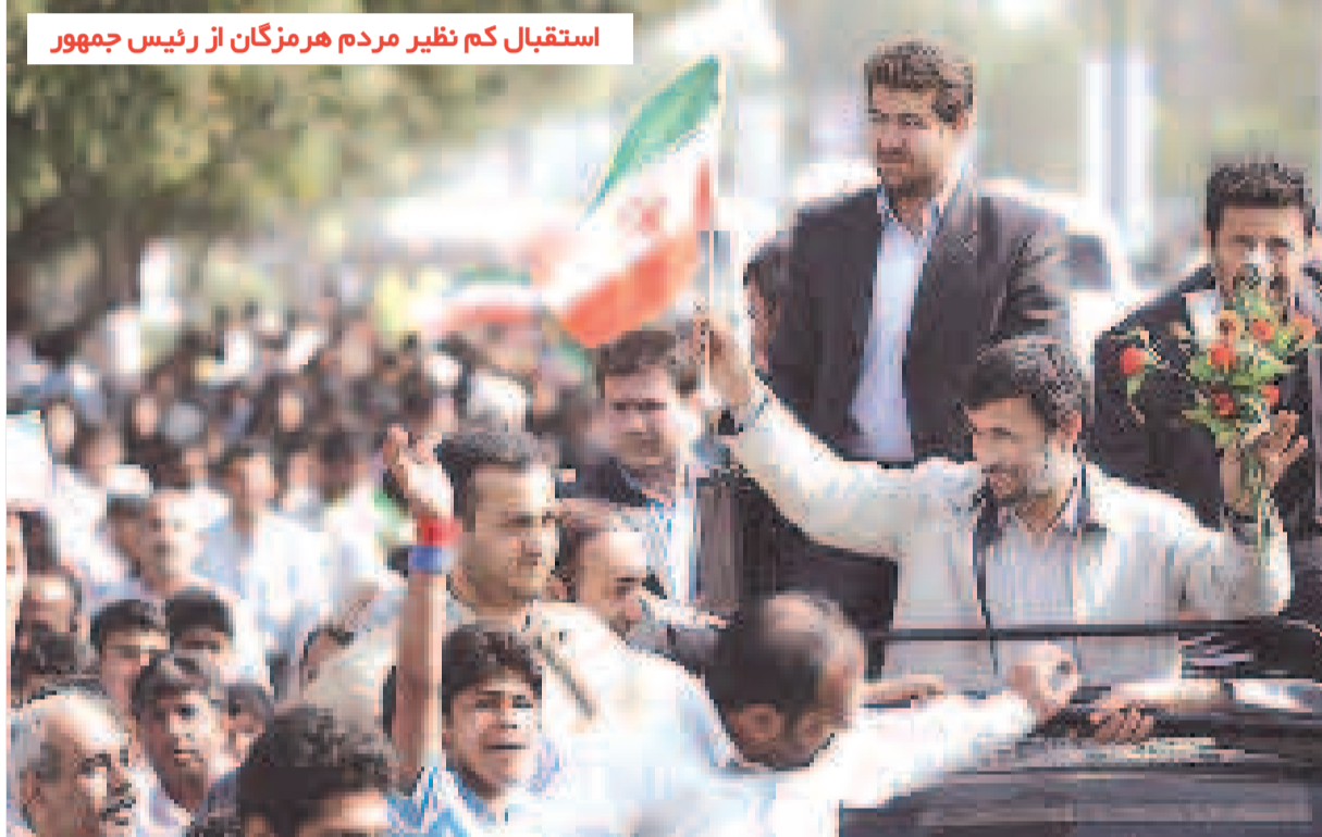
استقبال کم نظیر مردم هرمزگان از رئیس جمهور