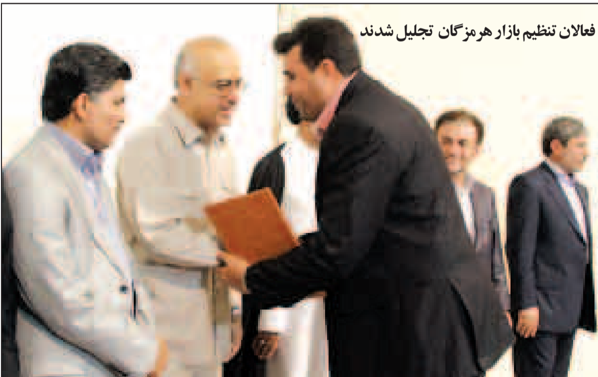
فعالان تنظیم بازار هرمزگان تجلیل شدند

سهم هر استان برای ایجاد یک میلیون و یکصد هزار شغل در سال ۸۹ که وعده داده شده بود، مشخص شده است.