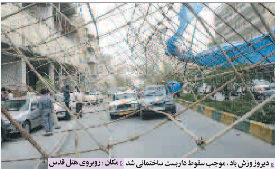
دیروز ورزش باد، موجب سقوط داربست ساختمانی شد. مکان: روبروی هتل قدس

الکلی، مواد مخدر و... نیز کشف شده است. رییس پلیس اطلاعات و امنیت استان همچنین از کشف ۱۰ هزار قوطی انواع مشروبات الکلی و دستگیری هشت منعم خبر داد و گفت: پلیس امنیت طرح برخورد با آلودگی صوتی و کسانی که به وسیله خودرو اقدام به حرکت های ماریج می نمایند را نیز در دستور کار دارد که طی این مدت ۴۰ خودرو به همین جرم توقیف شده اند. وی ادامه داد: در طرح جمع آوری اتباع غیر مجاز از جمله افاغنه نیز ۱۷۰۰ نفر دستگیر و از کشور طرد شدند همچنین ۱۸ دستگاه خودرو که در این رابطه مبادرت به جابجایی اتباع بیگانه غیر مجاز می نمودند توقیف شده است. سرهنگ داستانی در بخش دیگری از گزارش خود از کشف ۲۸ هزار انواع سی دهای مستهجن و اقلام ضد فرهنگی از جمله علائم شیطان پرستی از برخی صنوف متخلف خبر داد و گفت: در این ارتباط از فعالیت شش واحد صنعتی بدلیل تخلف یادشده جلوگیری شد.