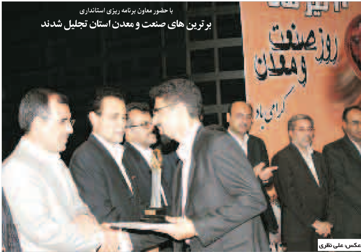
با حضور معاون برنامه ریزی استانداری برترین های صنعت و معدن استان تجلیل شدند