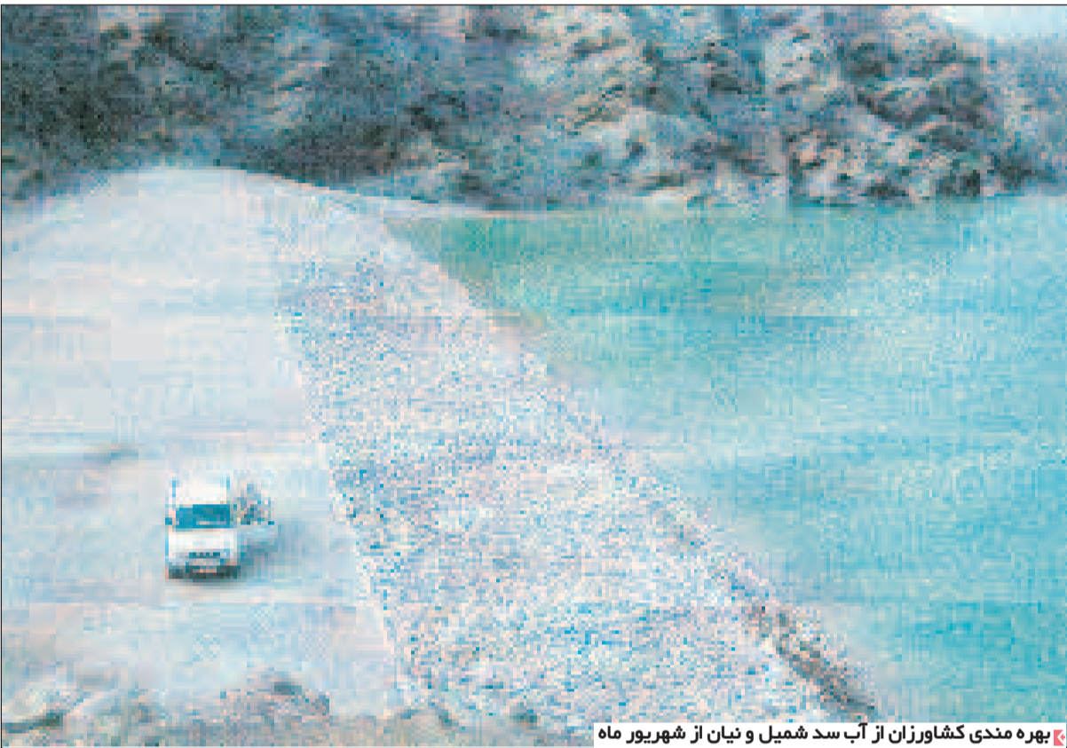
بهره مندی کشاورزان از آب سد شمیل و نیان از شهریور ماه