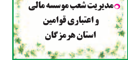
کمیته عالی و تجارت اقماعی