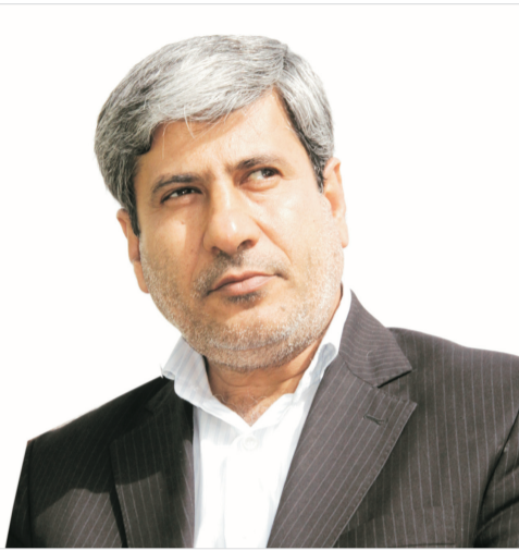
مدیرکل فنی و حرفه ای در گفت و گو با دریا