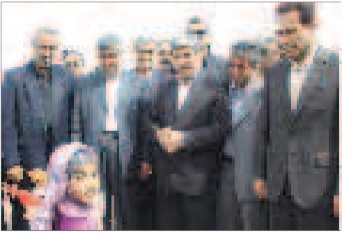
مدیران بندر لنگه در افتتاح پروژه های بندر لنگه

می بالد که با تکیه بر توان و دانش علمی خود بدون کمترین وابستگی به کشوری ممتاز و صاحب منزلت تبدیل شده است .