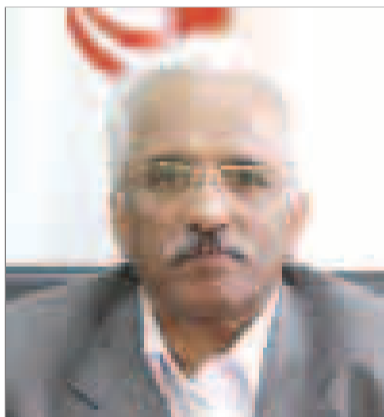
عبدالمجید جلالی - رئیس مجمع امور صنفی

مهم ترین و اثرگذارترین وظایف برعهده وزرات بازرگانی و سازمان های صنفی خواهد بود که درصاف مقدم این تحول بزرگ اقتصادی قرار دارند و به طور یقین بیشترین انتظارات و انتقادات را بایستی پاسخگو باشند.