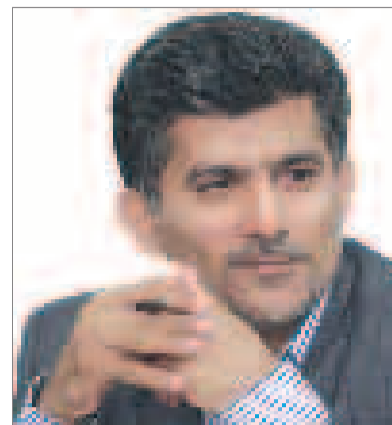
عبدلی زاده، رئیس سازمان بازرگانی هرمزگان