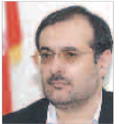
دکتر غنصفری، وزیر بازرگانی