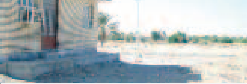
❖ گرد و خاک، خانه بهداشت را محاصره کرده است

این روستا که فاقد زمین ورزشی است و جوانان روستا در زمینی خاکی که گرد و خاک وارد حلقشان می شود