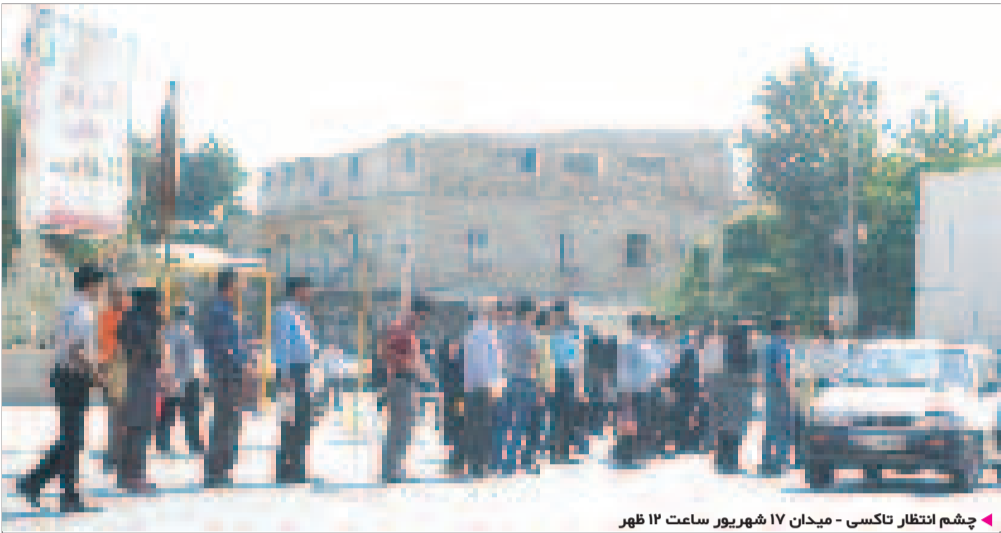
چشم انتظار تاکسی - میدان ۱۷ شهرویر ساعت ۱۲ ظهر

نقلیه هستند ولی تاکسی هایی هستند که در کنار خیابان پارک هستند و معلوم نیست به چه قشری می خواهند خدمات دهند. شهروند دیگری که در کنار میدان هفده شهرویر به انتظار تاکسی ایستاده بود گفت: چیزی که عیان است چه حاجت به بیان است ، خودتان که مشاهده می کنید خیل عظیمی از مردم در انتظار تاکسی هستند ولی هیچ تاکسی به داد این مردم نمی رسد. در این بین یکی از خانم هایی که منتظر تاکسی در میدان هفده شهرویر ایستاده بود ابراز داشت: در ساعت اوج مسافر تاکسی ها از خدمات رسانی به موقع به مردم عاجز می مانند و مسافران همچنان از مسافربرهای شخصی مدد می طلبند. بطوری که اگر این خودروها نباشند مردم ساعتها به انتظار می ایستند. این شهروندان در حالی این مطالب را بیان می کردند که گلايه شدیدی از کمبود تاکسی در ساعتی ۱۲ ظهر و ۸ شب در میدان هفده شهرویر داشتند.