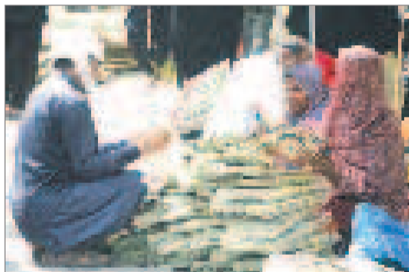
پنجشنبه بازار میباز

گزارش های مربوط به حوزه خدمات حمل و نقل شهری و انتظارات عمومی تاکتون بارها در صفحه روزنامه ها و قاب تلویزیون نمایان شده است و هر بار مردم ومسئولین هر کدام به نوعی از ضعف هایی در این مدیریت سخن به میان آورده اند .