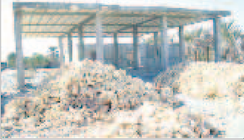
❖ مسجد در حال ساخت روستا

پله "ندارد" و افراد سالمند و باردار ، بیمار و .. برای ورود به خانه بهداشت با مشکل مواجهند. همچنین سیستم لوله کشی و آب خانه بهداشت مشکل دارد و علی رغم وجود چهار جا کولری درخانه بهداشت و خانه بهوزر، فقط یک لوکر دارد و از بیخچال و آمبولانس و آنگرمکن خبری نیست . اما این ساختمان نوساز دارای مشکل فنی بسیاری است که ترک خوردگی کاشی های خانه بهداشت و .. نشان از عدم رعایت اصول فنی دارد که گفته "بهبار" تمامی مشکلات فنی به دفتر فنی دانشگاه علوم پزشکی استان اعلام شده است ولی تاکتون اقدامی نشده است . همه این بیم و هراس را دارند که اگر حادثه ای مانند سیل و زلزله و بارندگی شود چه بر سر "مامن بهداشتی" روستا می آید ؟