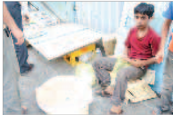
عرضه غیر بهداشتی نان