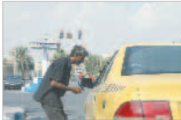
متکدیان همچنان در دچار راهها

کلیه هم استانی های عزیز از این پس ستون "دوربین در شهر" در روزهای می توانند عکس های مربوط به حوزه شهری شامل رخ دادها، انتقادی، حوادثی را به روزنامه دریا ارسال نمایند در تاریخ قابل چاپ می باشد.