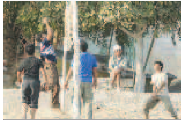
بازی نوجوانان در زمین خاکی