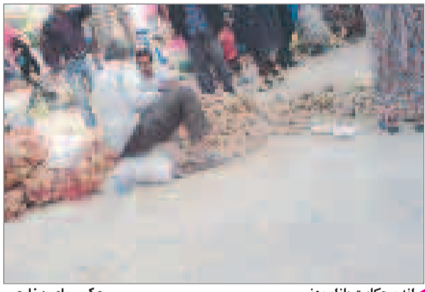
اندر حکایت بازار روز

زندگی شهرنشینی در دوره ماشین و تکنولوژی با همه پیشرفت‌هایش معضلاتی را نیز به همراه می آورد که از مهمترین مشکلات و گرفتارهایش نبودن آرامش و تمرکز اعصاب است به طوری که در طول شبانه روز بارها فشارهای زیاد عصبی به هر شهروند وارد می شود.