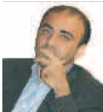
♦ شریف شریفی نژاد؛ شهردار بندرعباس