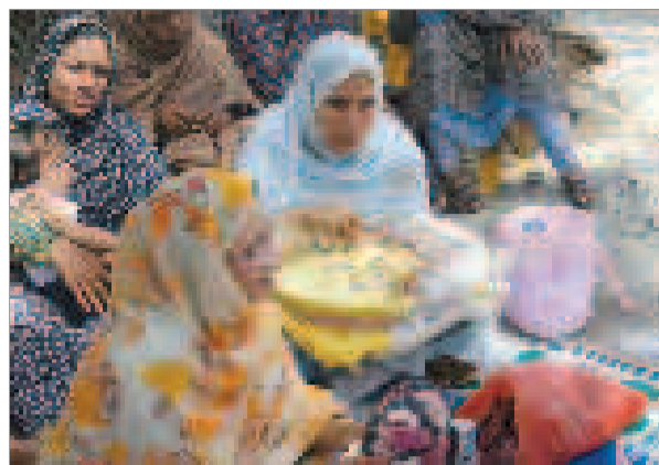
... و زنانی با دستانی آراسته به هنرهای زیبای جنوب!

شهری خواهیم ساخت درختانش همه سبز، آسمانش آبی و کوچه هایش خرم، شهری می سازم با مردمانی مهربان و باطراوت، خانه هایی سبز و دلپای گرم تا قصه سبزینه تازگی را زنده کنم و به مردمان شهر بگویم که زندگی بی طراوت و بی بهار زرد و خشکیده است. ۱۴ اسفندماه روز درختکاری نامیده شده و در تقویم ما ایرانیان ثبت شده است. روزی که سمبل طراوت و تازگی و سبزی و زیبایی نهال های نوریسته و شکفته است و ارمغان بوی بهار و زندگی طبیعت را می دهد. درخت از دیرباز در فرهنگ و آیین ما ایرانیان نشانه ای مقدس و ماندگار بوده و همگان بر رعایت حرمت و احترام آن سفارش بسیار کرده اند تاجایی که بزرگان دین اسلام و شریعت هم بر آن بسیار صحنه گذاشته و همه جا سخن از طبیعت پاک و سبز بوده است و امروز با حضور گسترده شهروندان در شهرها و ترک روستاها شاهد خشکی باغها و مزارع و دشتهای زیبا هستیم و شهرها به گورستانی از سنگ و سیمان و آجر و بلوک و برجهای سربلک کشیده مبدل شده است که طراوت و تازگی به دست فراموشی سپرده شده است و دیگر خنکای نسیم شامگاهی و صبحگاهی گونه هیچ دخترک و موهای پریشان پسران را نوازش نخواهد داد و مادر بزرگها و پدر بزرگها به یاد ایام خوش گذشته و باغهای سرسبز و درختان سربلک کشیده شهر و روستاهای خود روزگار می گذرانند و نسل جدید و امروزی معنای طراوت و سرسبزی را به خوبی درک نمی کند چرا که بدون هیچ احترام و احساسی از کنار درختان و گلهای گذشته و بعضا با چیدن گلی از شاخه طراوت را به دوستی هدیه می دهد.