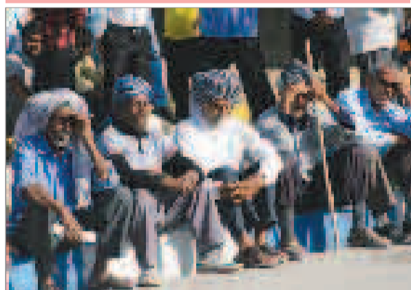
جوانان دیروز فین که فارغ بال به امروز فین می نگرند