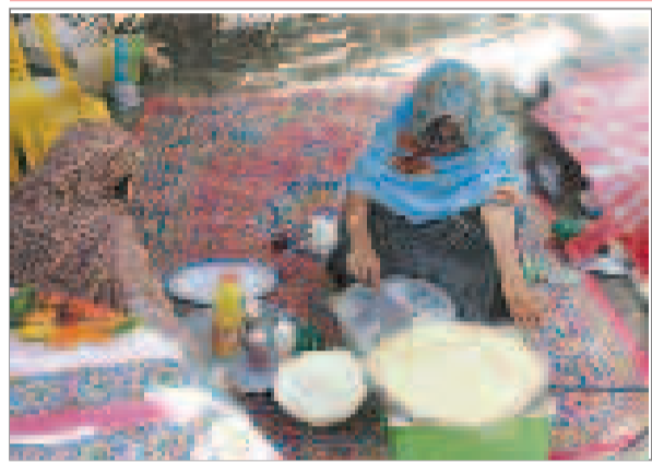
زنانی هومند که نمادی از زیبایی جنوب را بدک می کنند