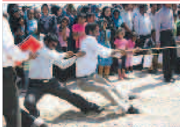
سایه طالب کنی مردان فینی