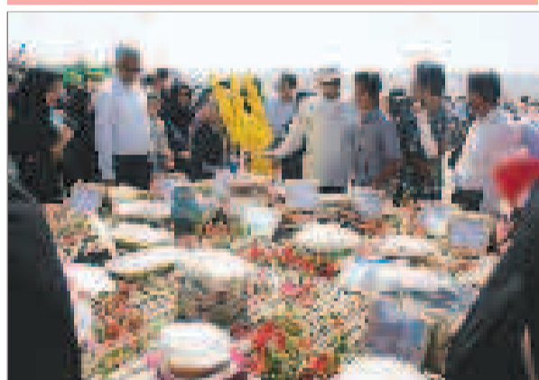
گوشه هایی از همایش بزرگ بین شامی