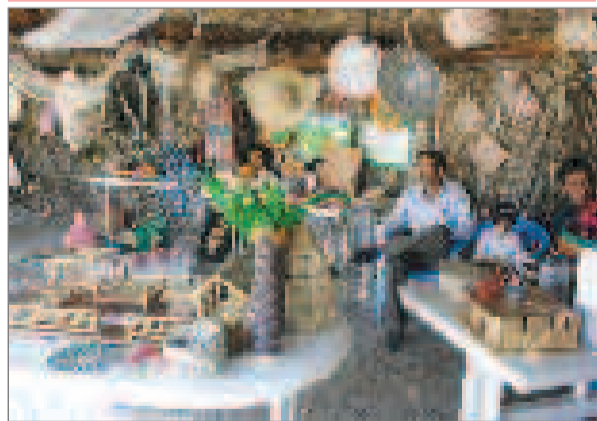
غرفه صنایع دستی در همایش بین شامی