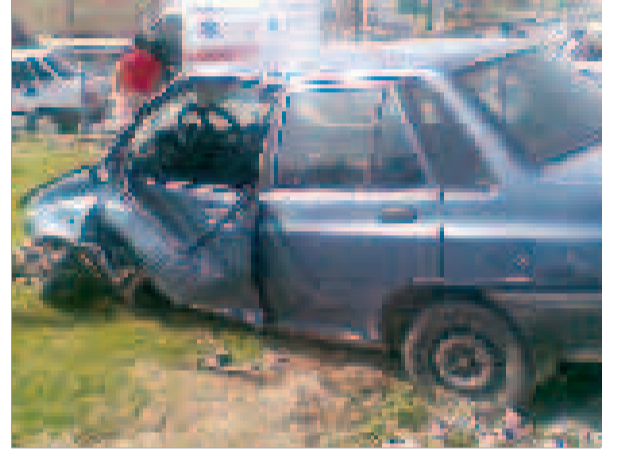
پوش مجزه آسای "پراید" به وسط میدان صادقیه، تندیس جدید میدان صادقیه جمعه ساعت ۱۳:۳۵