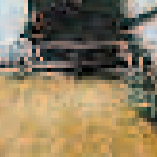
روزانه عمیق باران در حیات کشاورزی شرمش تان