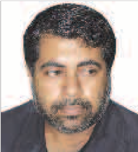
پیشداد: معاون فرهنگی ارشاد