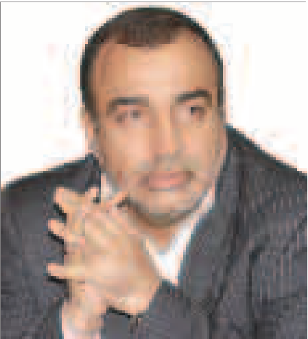
پراو: معاون سیاسی امنیتی