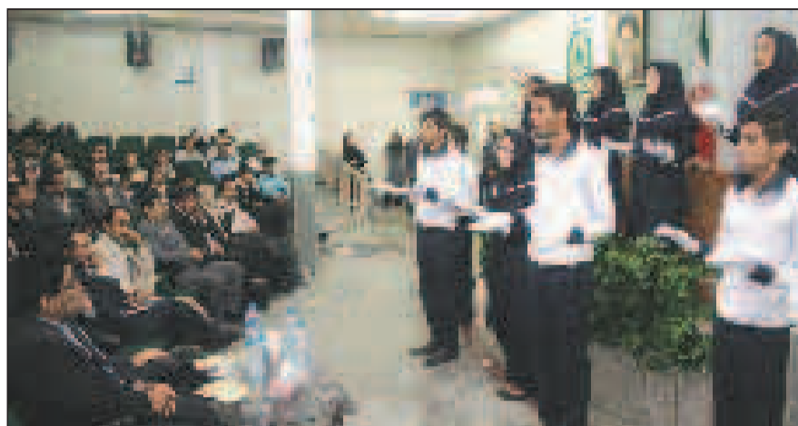
اجرای برنامه توسط گروه هنری ناشنویان