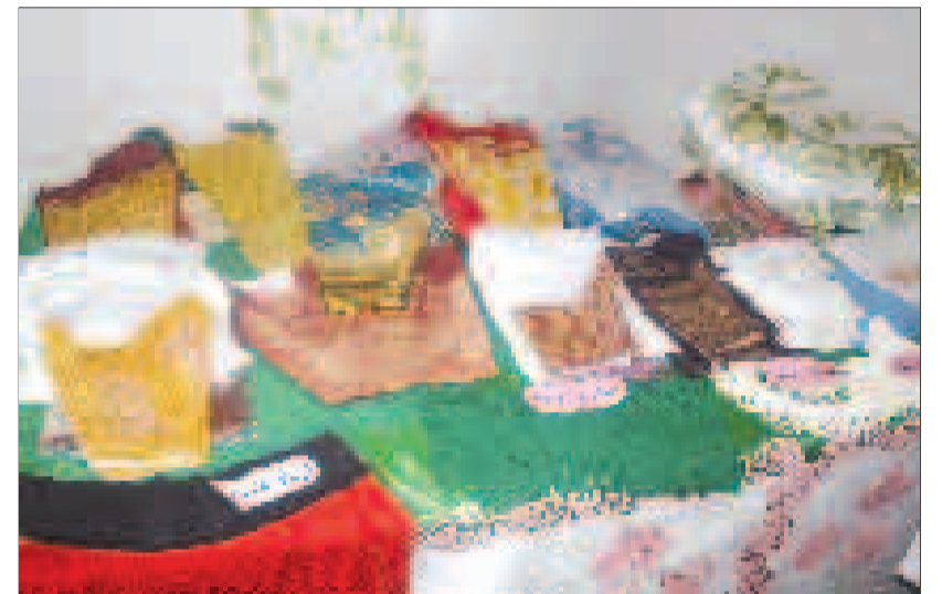
توانمندی مددجویان بهزیستی