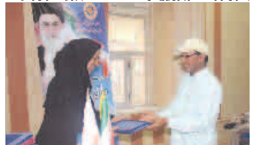
تجلیل از بازنشستگان بهزیستی

مصرف آبریان از انواع سکه های مغزنی و قلبی جلوگیری می کند