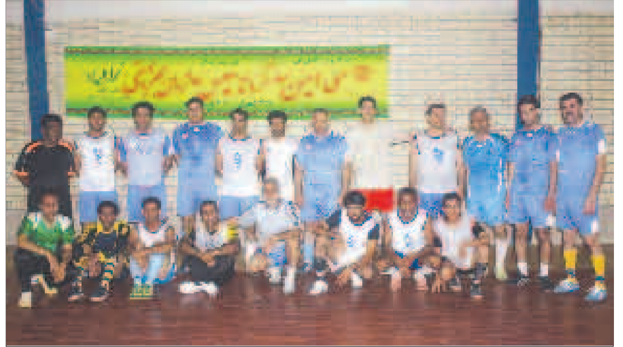
تیم ورزشی آقایان سازمان بهزیستی هرمزگان