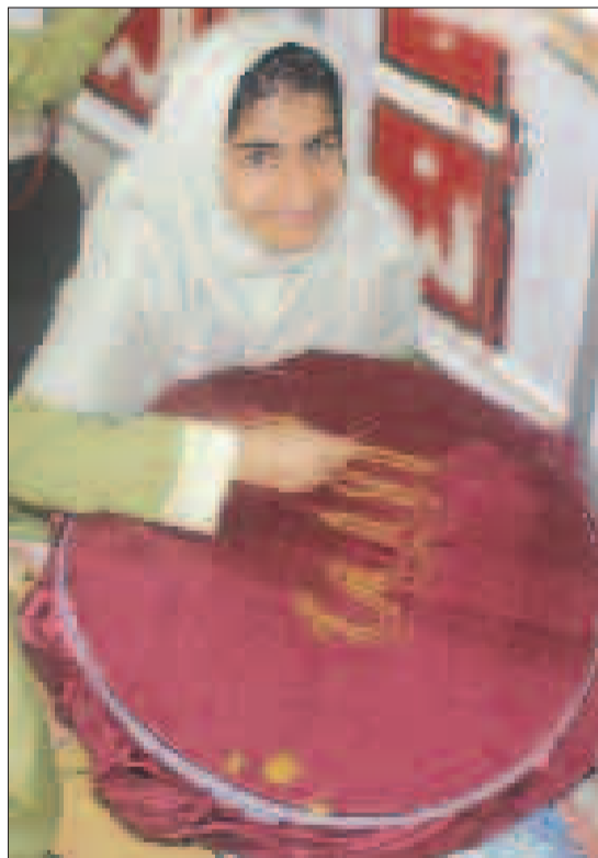
مددجوی توانمند بهزیستی هرمزگان