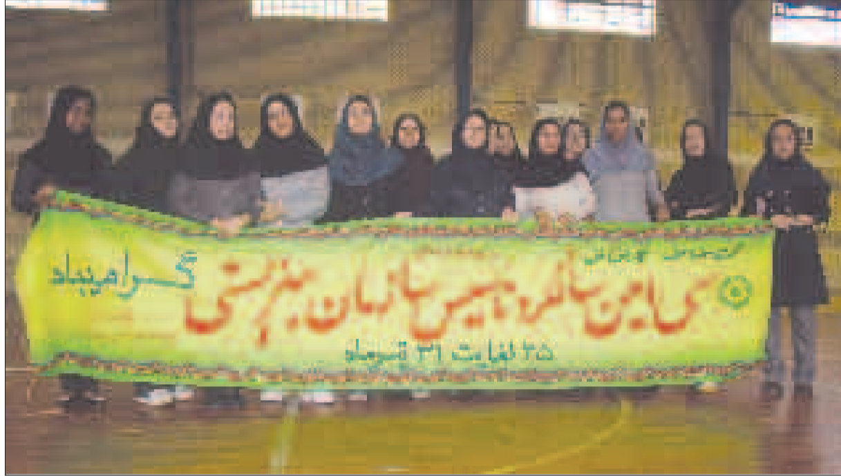
تیم ورزشی بانوان سازمان بهزیستی هرمزگان