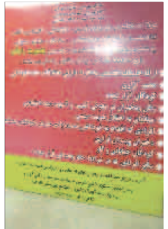
معرفی مرکز مداخله در بحران بهزیستی