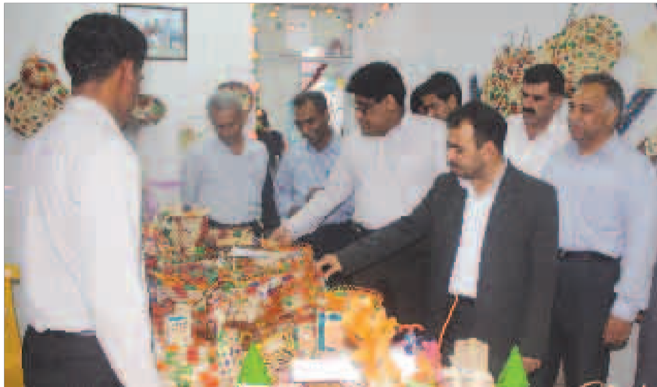
بازدید مسئولان از نمایشگاه دستاوردهای بهزیستی