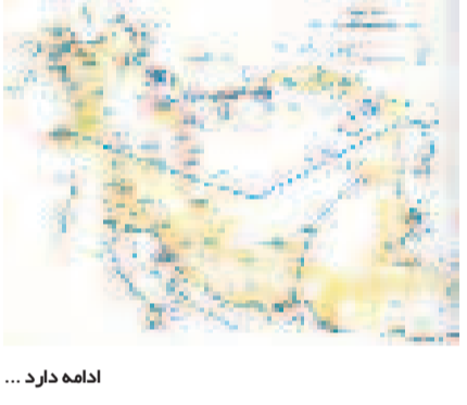
ادامه دارد ...

بعلاوه طبق دستور وزارت خارجه آلمان ،سفارت آلمان در ایران بموجب نامه ای رسمی بمن نوشت که دولت آلمان ، بعد از خاتمه جنگ اینچنانی با بخرج دولت آلمان برای اتمام تحصیلات عالی به برلن خواهد فرستاد.