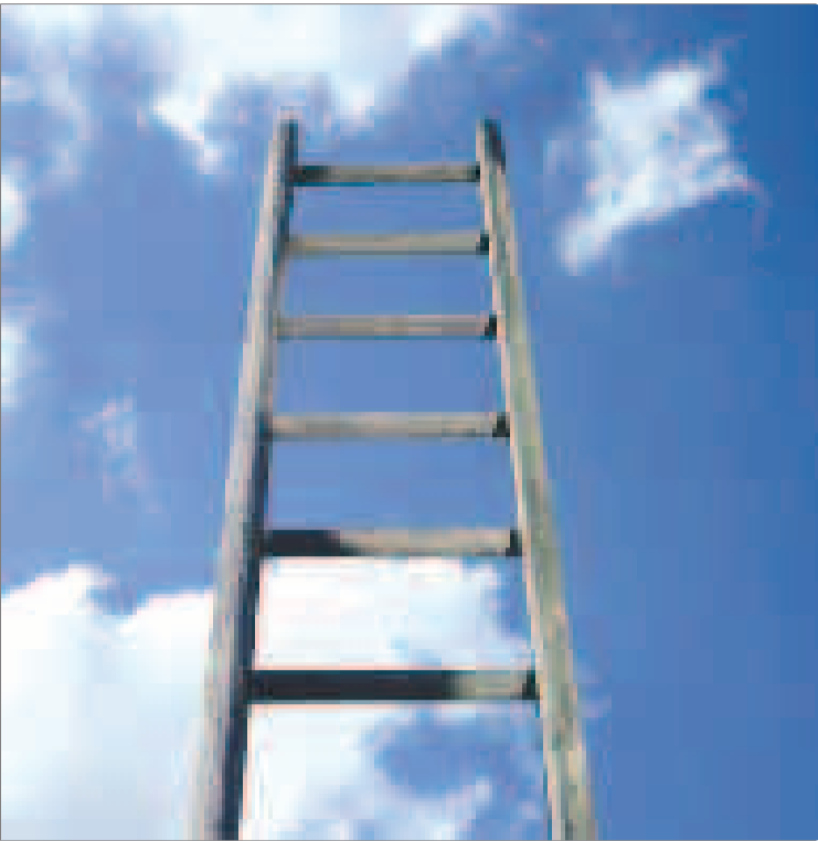
تصویر گویای موفقیت و رسیدن به اهداف است.

گاهی موجب زیان های جبران ناپذیر می شود . تکنیک توهم خلاق خیلی وقت ها آن چه فکری می کنیم واقعیت است . واقعیت نیست و اقعیت با پنج حس انسان درک می شوند . فرض بر این است که حواس پنجگانه گزارش دقیق ودرستی از محیط اطراف به انسان می دهند . آیا واقعاً همین طور است ؟ چیزهایی که چشم شما می بیند وطوری که مغزتان آنرا تفسیرمی کند باعث این خطا یا توهم می شود. چشم می بیند ، اما وظیفه ی ذهن چیز دیگری است کار ذهن مرتب کردن دسته بندی و قابل فهم کردن جرقه هایی است که پس از این بدین ،مغز آن را ایجاد می کند . بنابراین تصاویری که در ذهن شما است ، کپی مستقیم اشیاا نیست ، بلکه کدهای خلاصه ای است که از طریق شبکه عصبی به مغز می رسند. همه ی افراد در همه ی مواقع درک یکسانی از یک موضوع ندارند و ارتباط ادراکی چشم ومغز همیشه منجر به درکی منسجم از واقعیت نمی شود. حتی گاهی این دو با هم تضاد هستند .