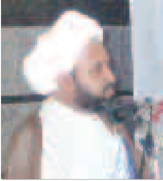
حجت الاسلام معتمدی فرد امام جمعه میناب

در دوره پنجم بزرگسالان بخشی از فعالیت های این اداره است. رئیس اداره نهضت سوادآموزی میناب اظهار داشت: از ابتدای تشکیل نهضت سوادآموزی میناب در سال ۶۰ تاکنون ۸۲۴ آموزشگاه در این اداره به کار گرفته اند که ۲۵۰ نفر از آنها موفق به انتقال به آموزش و پرورش و استخدام رسمی شده اند. همچنین در این مدت ۶۸ نفر راهمای تعلیماتی، ۳۶ نفر مدیر مرکز و ۵۲ نفر پرسنل کادر اداری در اداره نهضت سوادآموزی مشغول به کار شده اند. در ادامه امام جمعه میناب گفت: یکی از ناهمادی های پرکار و سخت کوش انقلابی نهضت سوادآموزی است حجت الاسلام معتمدی فرد افزود: بیشترین زحمات و تلاشها را مسئولین نهضت سوادآموزی بخصوص آموزشیاران با دست خالی و پای پیاده و حداقل امکانات انجام می دهند. وی اظهار داشت: به نهضت سوادآموزی باید توجه و حمایت بیشتری انجام شود تا بتواند به رسالت خود عمل کند. نهضت سوادآموزی باید از طریق موقوفات مورد حمایت قرار گیرد. امام جمعه میناب تصریح کرد: عمده کار نهضت سوادآموزی ایجاد زمینه و تشنگی در سوادآموزی است. اگر بتوانیم این تشنگی را ایجاد کنیم به وظیفه خود عمل کرده ایم اما تبلیغات در این زمینه ضعیف است. وی گفت: جامعه ما باید تشنه و گرسنه علم و دانش باشد. ما باید زمینه ای ایجاد کنیم تا بیسواد به دنبال سواد بیایند. در پایان از دهیاران و مسئولین شوراهای روستایی که پایان بی سوادی در آنها اعلام شد همچنین آموزشیاران نهضت سوادآموزی میناب تجلیل شد. این مراسم با اجرای برنامه های شاد و متنوع همراه بود.