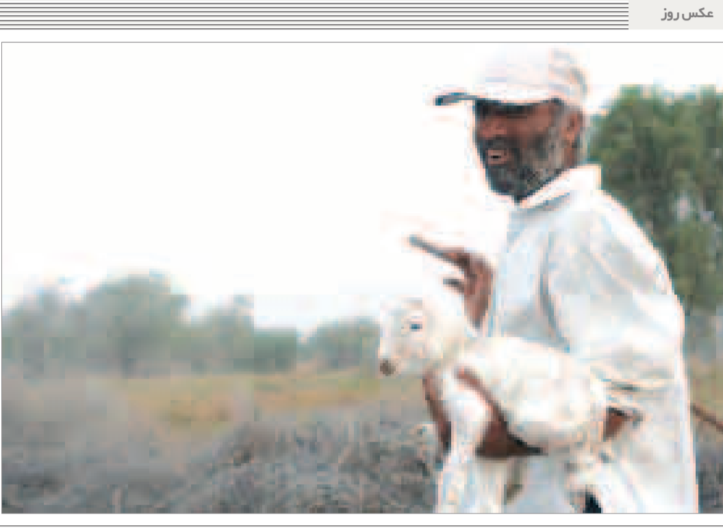
معاون فرماندار بستک