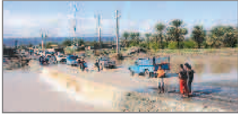
باران میهمان ناخوانده ای که همه چیز را با خود می برد

وقتی سیل بی خبر به دل کوه ودشت و روستای زند