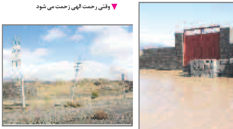
وقتی رحمت الهی زحمت می شود