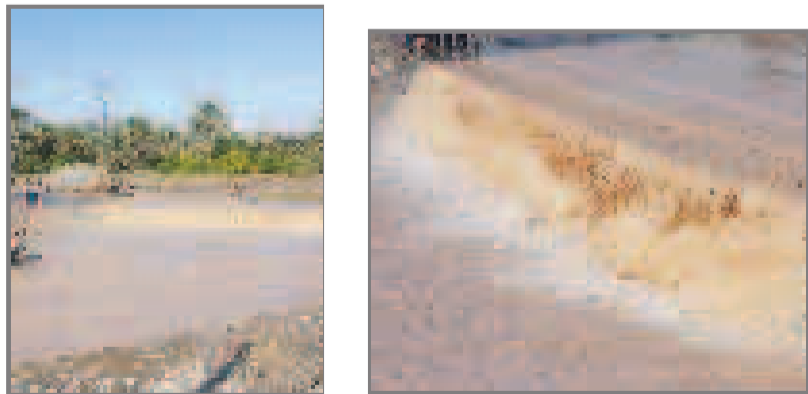
روستائیان گرفتار سیل ناخوانده