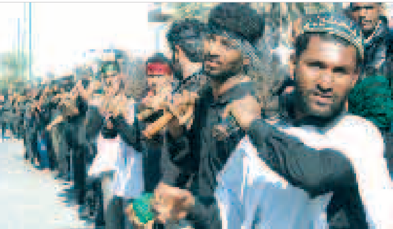
باز این چه نوحه و چه عزا و چه ماتم است