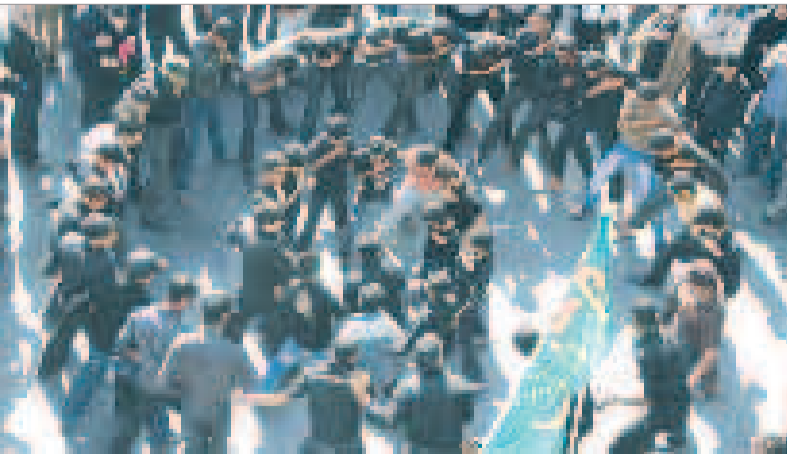
حلقه مشتاقان حسین (ع) و انعکاس شور حسینی در سینه ها