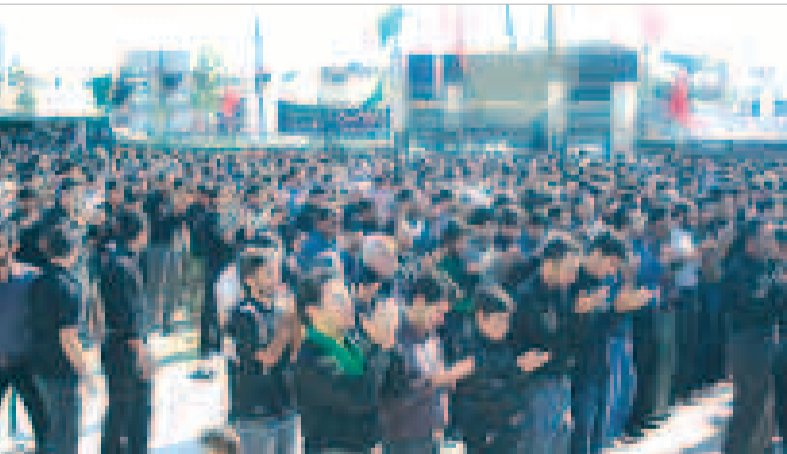
نماز ظهر عاشورا - صحن امامزاده سید مظفر

امثال من و تو زیادند که دست به سینه ایستادند و کاری هم به عمق حادثه که نه؛ فرهنگ عاشورا ندارند!!! دو طرف بولوار را حصار کردیم و با نگاهمان که گویی "صحنه جالبی است" هیئت ها را تنها نظاره کردیم! باورش سخت است که انگشت شمارند کسانی که (از تماشاچیان) سینه می زنند! با نگاه آنها را دنبال می کنی تا به رقم بزرگتری برسی اما دوباره به هیئت ها ختم می شوی، شرمنده شور حسینی هیئت ها می شوی، در خودت غرق می شوی با کوله باری از حسرت عاشورای سالهای گذشته!!!!!! ● کمی به عقب برگردیم، زمانی آمدها خالص تر بودند و نپاشان صاف تر، زمانی که پیرو جوان از ته دل و عاشقانه عزاداری می کردند، به زمانی برگردیم که دستجات عزاداری به کارناوال تبدیل نشده بود، اتفاقی که امروز افتاده؛ هیئت های عزاداری در وسط خیابانها و میدانها و مردم هم دو طرف یا دور تا دور شان ایستاده و در حال تماشا هستند و خیلی ها هم بی هدف به دنبال این دستجات راه می افتند در حالیکه دیگر اثری از شور عزاداری در میانشان به چشم نمی خورد!!!! و جای بسی تأسف است که برخی مداحان سعی دارند به هر قیمتی و با تاکید افراطی بر عواطف و احساسات عمومی و اعمال سلیقه شخصی در بیان واقعه کربلا، انگ مردم را در آورند!! و جای بسی تأسف است که قرباناست از لب تشنگی حسین (ع) می گویند و ما بی آنکه فلسفه گریستن همامان به حسین (ع) را بدانیم، می گرییم و خیال می کنیم که با "یا حسین" گفتن حق را