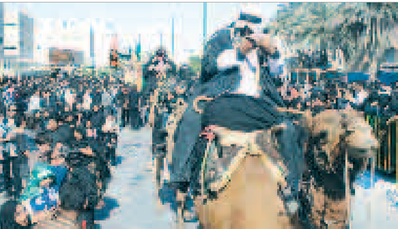
ای ساربان آهسته ران کارام جانم می رود...