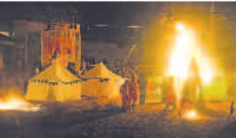
شام غریبان - کوی آیت... اغاری