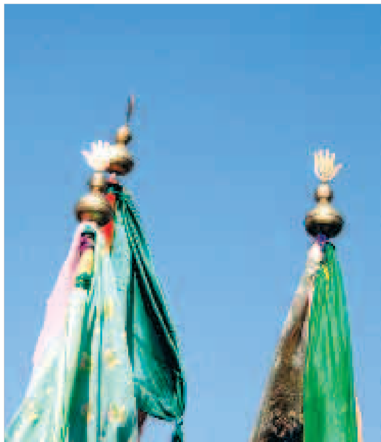
جلوه شور حسینی در هرمزگان