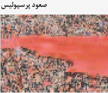
صعود پرسپولیس با آهنگ بندری