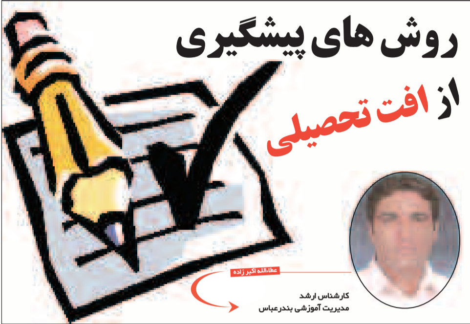
مقاله تکبر زاده