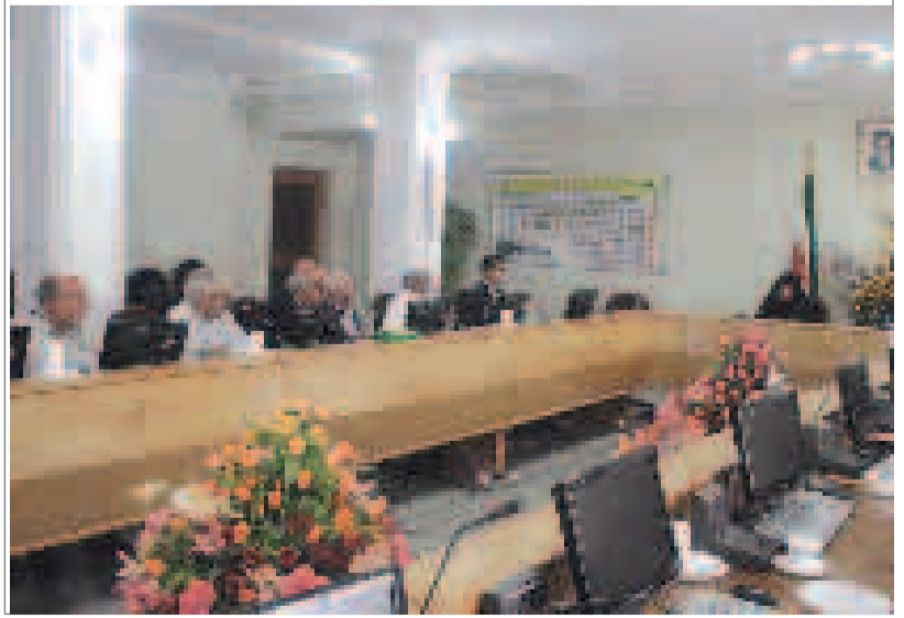
نشست مجمع خیرین سلامت هرمزگان با وزیر بهداشت