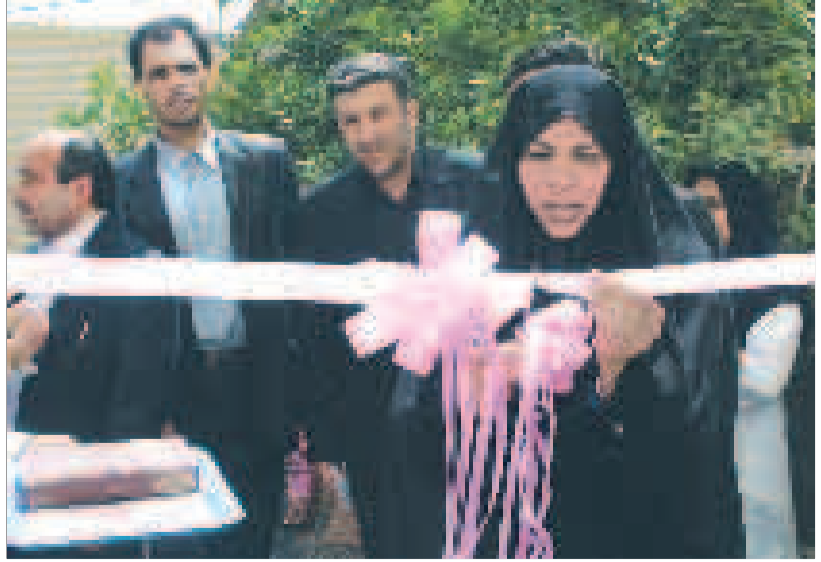
افتتاح پایگاه بهداشتی شماره ۱۴ بندرعباس با حضور وزیر بهداشت