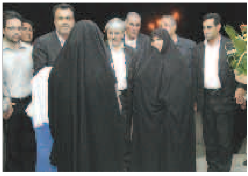
بازدید وزیر بهداشت از بخشهای درمانی