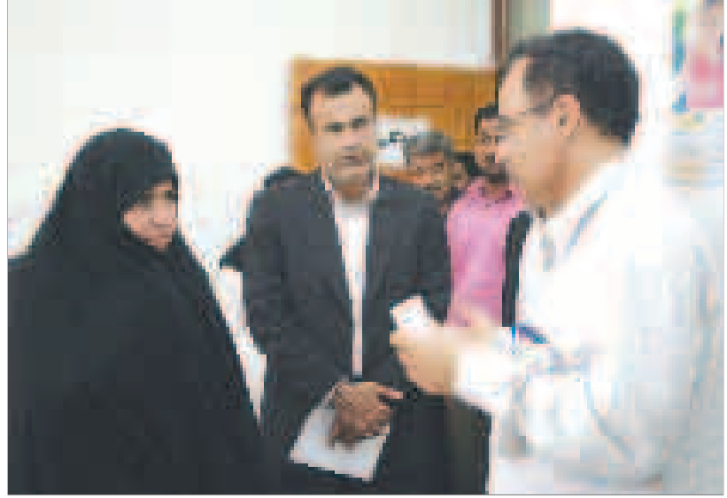
افتتاح پایگاه بهداشتی شماره ۱۴ با حضور وزیر بهداشت