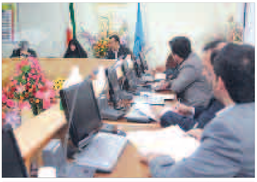
هیئت رئیسه دانشگاه با حضور وزیر بهداشت و شورای معاونین