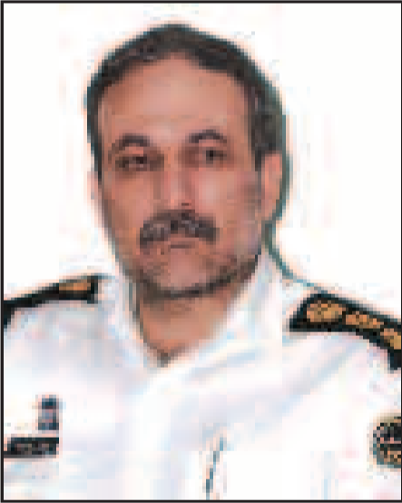
◀ سرهنگ اصغر قطب زاده،رئیس پلیس آگاهی استان

وی ادامه داد: طبق اعترافات این دو ، آنها پس از رسیدن به جاده راه آهن ،راننده تاکسی را با ضربات چاقو به قتل می‌رسانند و