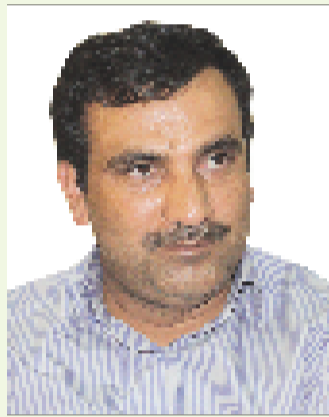
مهندس دیده؛ سرپرست خدمات شهری شهرداری بندرعباس