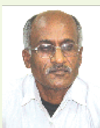
اسفندی؛ شهروند نمونه و دوستدار فضای سبز