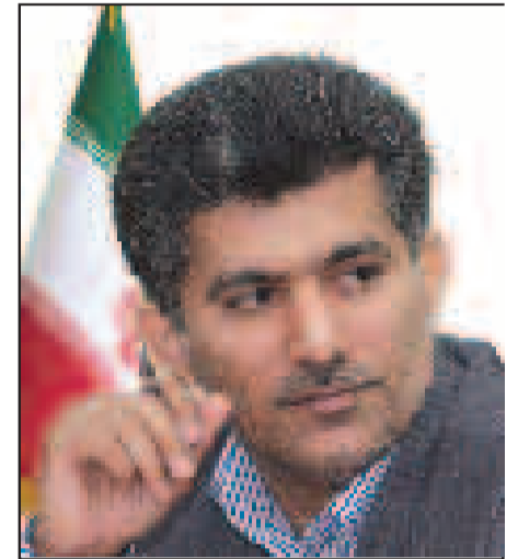
عبدالمجید عبدلی زاده؛ رئیس سازمان بازرگانی

در همراهی با افتخارات اتحادیه های صنفی شهرستان ها، کمیسیون های شهرستانی نیز صاحب رتبه شدند و شهرستان