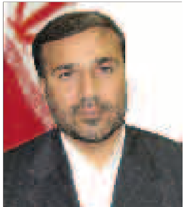
دستگیران رئیس سازمان بنیاد شهید و امور ایثارگران هرمزگان

اما واقعا چه زیباست که جانبازان میهن روزی را به نام خود دارند که میلاد باب الحوائج عالم هستی، حضرت عباس بن علی(ع) است و جانبازان و ایثارگران با ناسی از آن حضرت، سختی هایی که به واسطه جانبازی بر آنها تحمیل شده است را بر خود هموار می کنند.