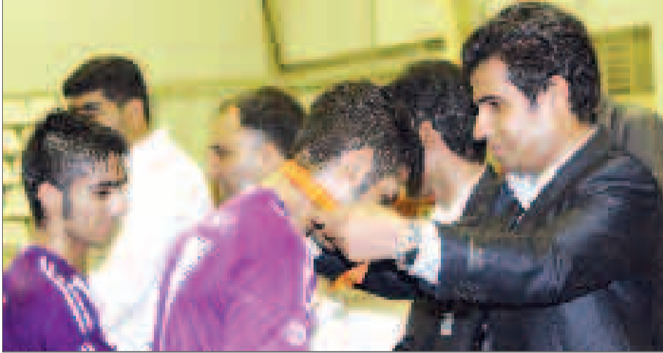
اهدای محال قهرمانی به تیم اول توسط شرکت توسعه عمران شهر گردشگری بین المللی خلیج فارس