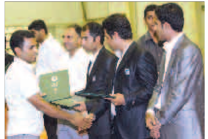
تقدیر از کمیته برگزاری