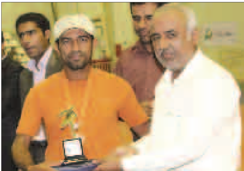
سرپرست تیم اول